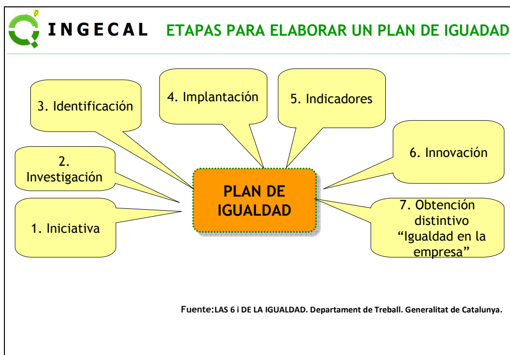
Fig. 2. Etapas para la elaboración de un plan de igualdad