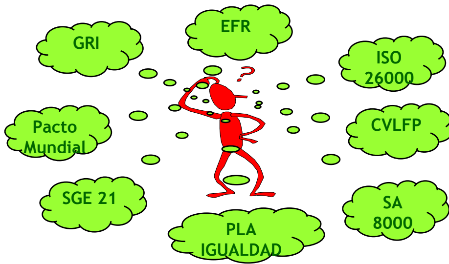
Fig. 3. Algunos de los modelos de Responsabilidad Social más utilizados